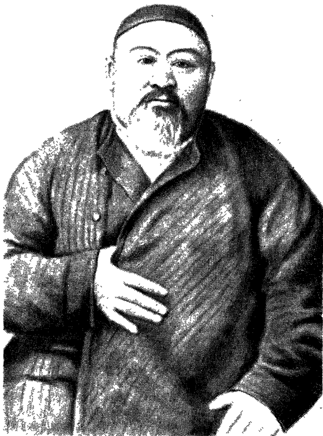
Абай (Ибрагим) Кунанбаев.

Литературная критика, многократно обращавшаяся к анализу эпопеи М. О. Ауэзова, единодушно отмечала наличие и творческое развитие автором названных выше важнейших черт, присущих лучшим советским историческим романам.