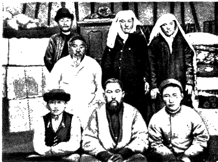
Абай в кругу семьи.